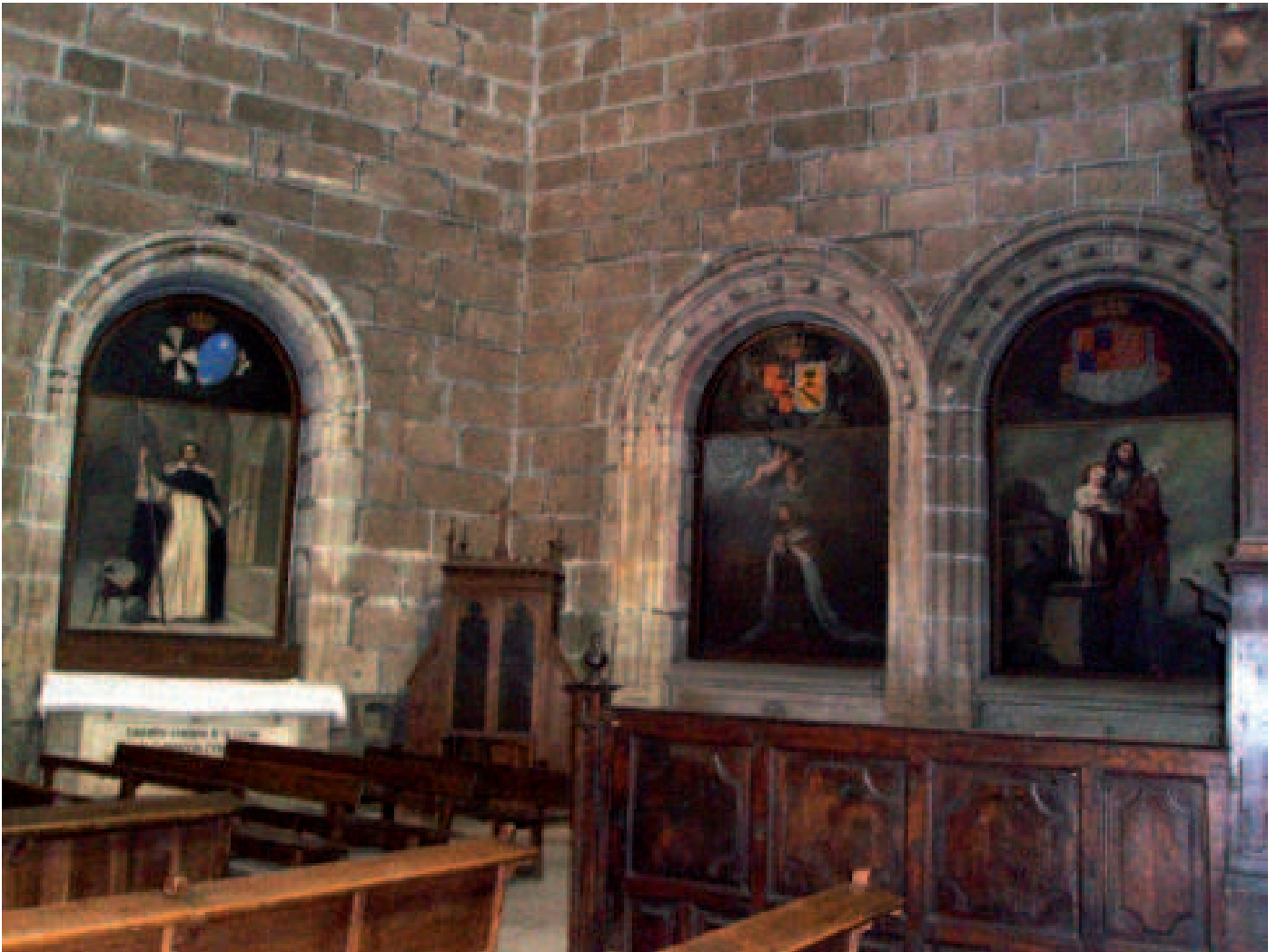
Interior de la capilla de Mosén Rubí

en los gnósticos, que buscaban la gnosis, el conocimiento profundo, y que afirmaban poder alcanzarlo sólo ellos. Ya el Papa León XIII, en su encíclica "In eminenti", explicaba que "la masonería es la actualización del paganismo antiguo y el gnosticismo". El gnosticismo nació como una reacción pagana contra