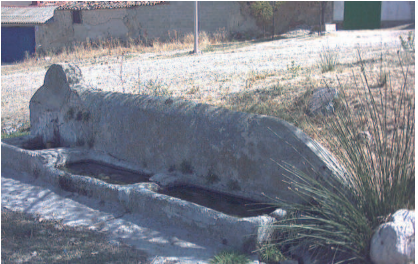
Caño Chico con pilas de piedra labradas a mano

Dentro de su espléndida edificación destaca su retablo mayor, y los dos que albergaban a los santos con los que se procesiona en Semana Santa, destacables por su equilibrada profusión de imágenes, otros altares posteriores de los cuales uno fue desprendido para instalarse en la ermita del pueblo, tras descabellada decisión. Tiene asimismo, un bello pulpito del siglo XVI y un órgano barroco del que desconocemos su autor, probablemente Francisco Ortega.