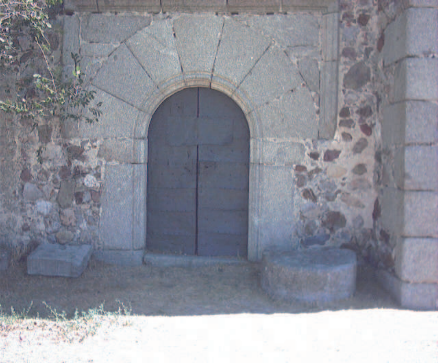
Puerta del Sol de la Iglesia Nuestra Señora de la Asunción

recoge treinta y tres surtidores subterráneos de agua de manantial muy buena y saludable.