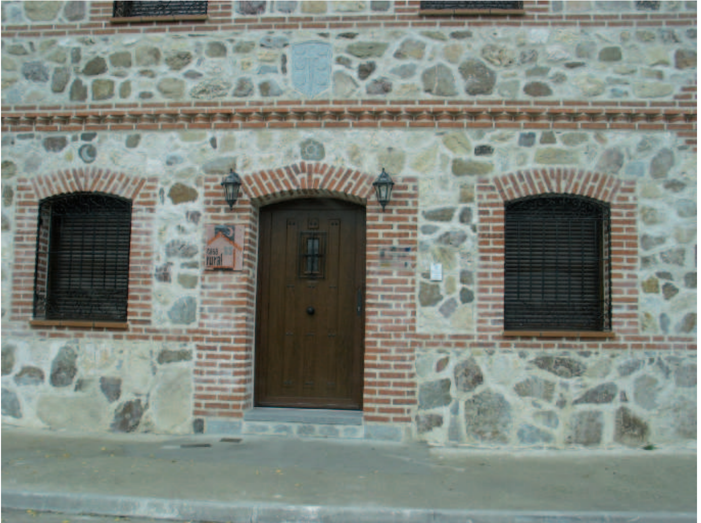
Fachada de la casa rural Duquesa de la Conquista

usurpar la propiedad de las tierras de la Duquesa de la Conquista, de las que son titulares los miembros de la Cooperativa Asunción de Nuestra Señora, para otorgárselas al Ayuntamiento. Una lucha en la que es empeñan dirigentes y adláteres que gastan fuerzas actualmente por destruir el estado de derecho.