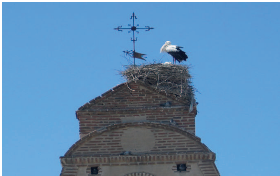
Nido de cigüeña en la torre de la ermita de Vega de Santa María

Lugares de interés: Iglesia parroquial dedicada a Nuestra Señora de la Asunción. Su imponente fábrica mudéjar da cuenta del inicio de su construcción en el siglo XI, aunque puede que so se terminara has-