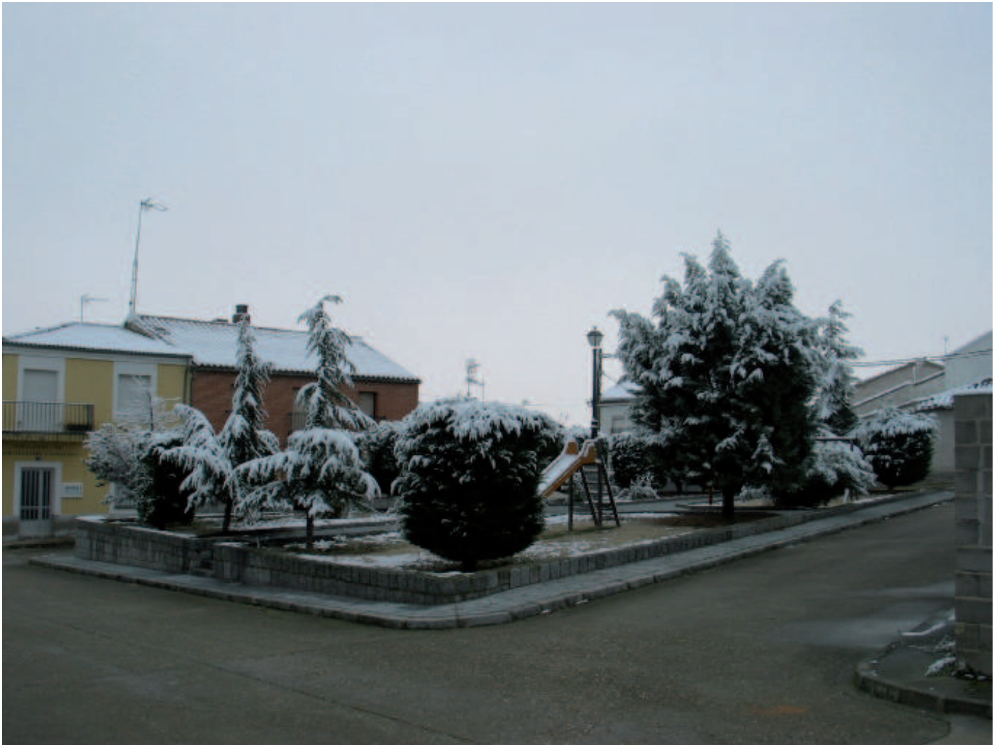
El parque infantil nevado

peregrinos, viajeros buscando la Castilla ancha, que tomaban como referencia la iglesia de la asunción.