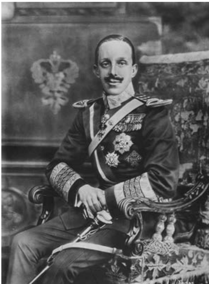
Fotografía de Alfonso XIII en 1916

Preceptor era un oficio de carácter superior, restringido al ámbito de la enseñanza, habitualmente especializado por disciplinas académicas (a través de la lectura de textos en latín) u otras habilidades (música, equitación, esgrima, etc.)