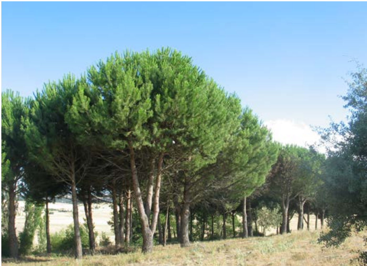
Un pinar de Vega de Santa María

a este producto tomando como base, en gran parte, las experiencias derivadas del aprovechamiento de resinas de la Landas francesas, en las que ya se venía cultivando este producto desde 1810.