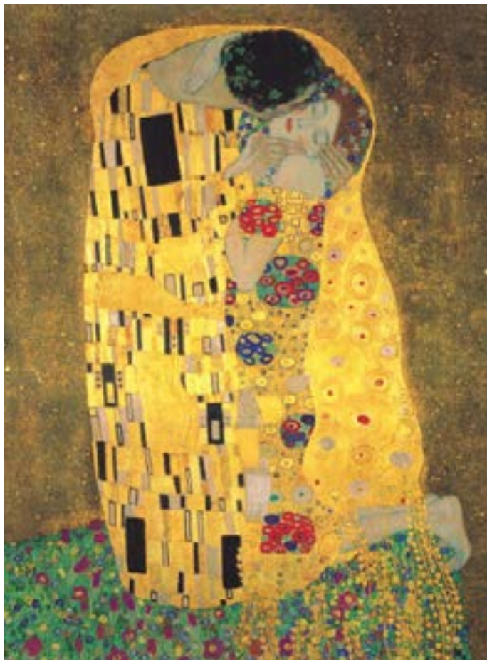
Arriba, el beso de Kimt , abajo Drawing for a kiss de Roy Lichtenstein