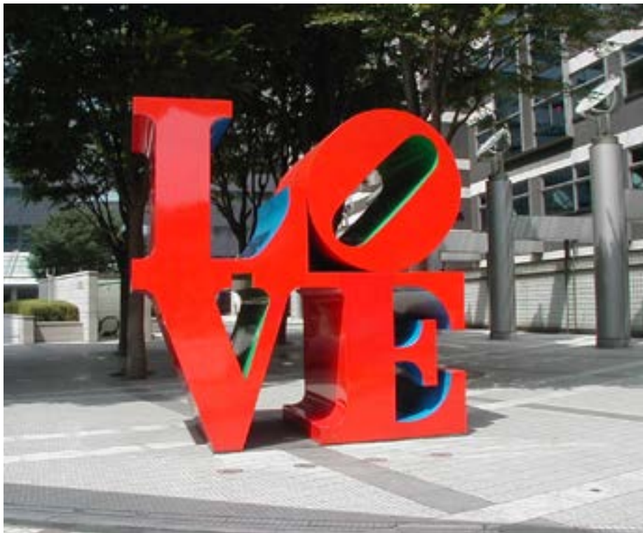
Arriba la escultura Love de Robert Indiana, abajo el Reloj de la Duquesa perteneciente al Museo VSM de Vega de Santa María