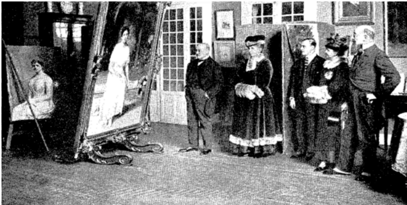
Visita de la Reina Madre al estudio del pintor Moreno Carbonero acompañado de la Duquesa de la Conquista

des a su categoría social y no faltaban los tocados típicos de la época.