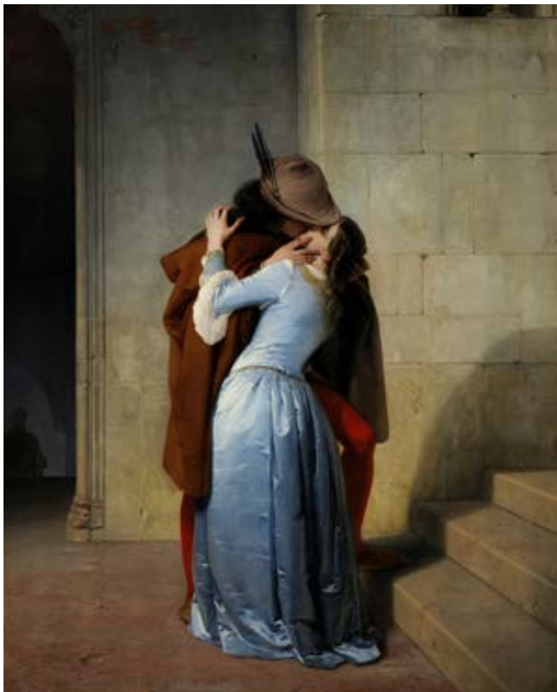
Obra de El Beso de Francisco Hayez

yándose en la mitología clásica con en el caso obra Psique de Antonio Canova, que es la representación de aquel beso que Eros dio a Psi-