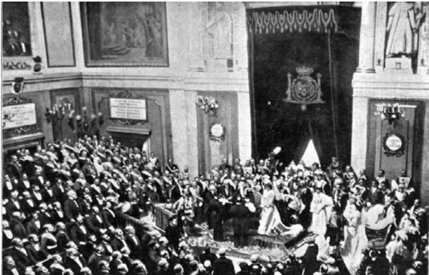
Imagen de la jura de Alfonso XIII en el día de su coronación el 17 de mayo de 1902

último caso corresponde aproximadamente con la posición de gobernador o virrey