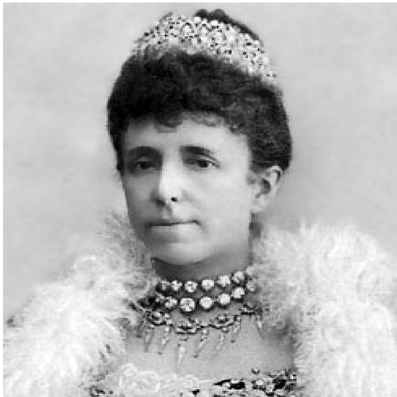
M a Cristina de Habsburgo-Lorena, Reina Madre